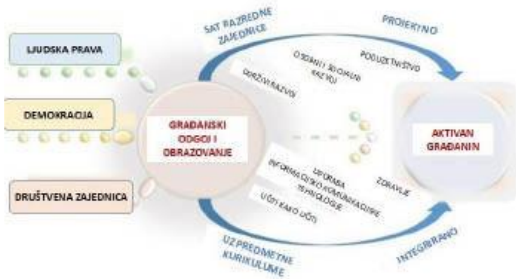
Shematski prikaz Međupredmetne teme Građanski odgoj i obrazovanje

Temeljne vrijednosti koje se promiču učenjem i poučavanjem Građanskog odgoja i obrazovanja su odgovornost, ljudsko dostojanstvo, sloboda, ravnopravnost i solidarnost. Osobita važnost pridaje se razvoju odgovornog odnosa prema javnim dobrima kao i spremnosti pojedinca da doprinosi širenju, razvoju i održavanju zajedničkih javnih dobara.