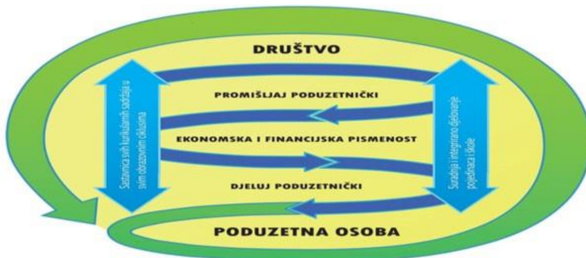
Prikaz domena u međupredmetnoj temi Poduzetništvo

Svrha učenja i poučavanja ove međupredmetne teme je razvijanje poduzetničkoga načina promišljanja i djelovanja u svakodnevnom životu i radu.