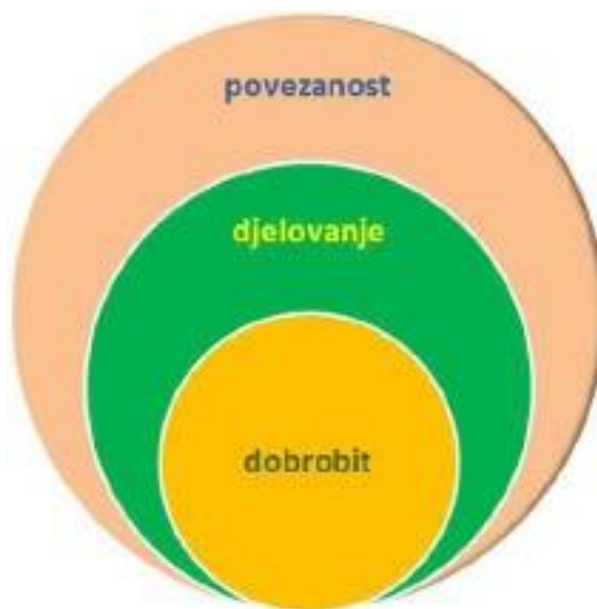
Domene u organizaciji kurikulumu međupredmetne teme Održivi razvoj

Međupredmetna tema Održivi razvoj razvija i širi znanja o funkcioniranju i o složenosti prirodnih sustava i o posljedicama ljudskih aktivnosti. Osim toga razvija solidarnost prema drugim ljudima, odgovornost prema okolišu, vlastitom i tuđem zdravlju, kao i odgovornost prema cjelokupnome životnom okruženju i prema budućim generacijama. Odgojno obrazovna očekivanja podijeljena su u tri domene, a to su povezanost, djelovanje i dobrobit.