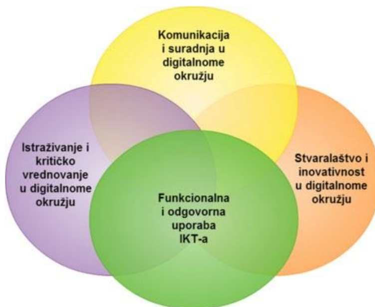
Struktura međupredmetne teme Uporaba informacijske i komunikacijske tehnologije

komunikacijskom tehnologijom u svim predmetima, područjima i na svim razinama obrazovanja.